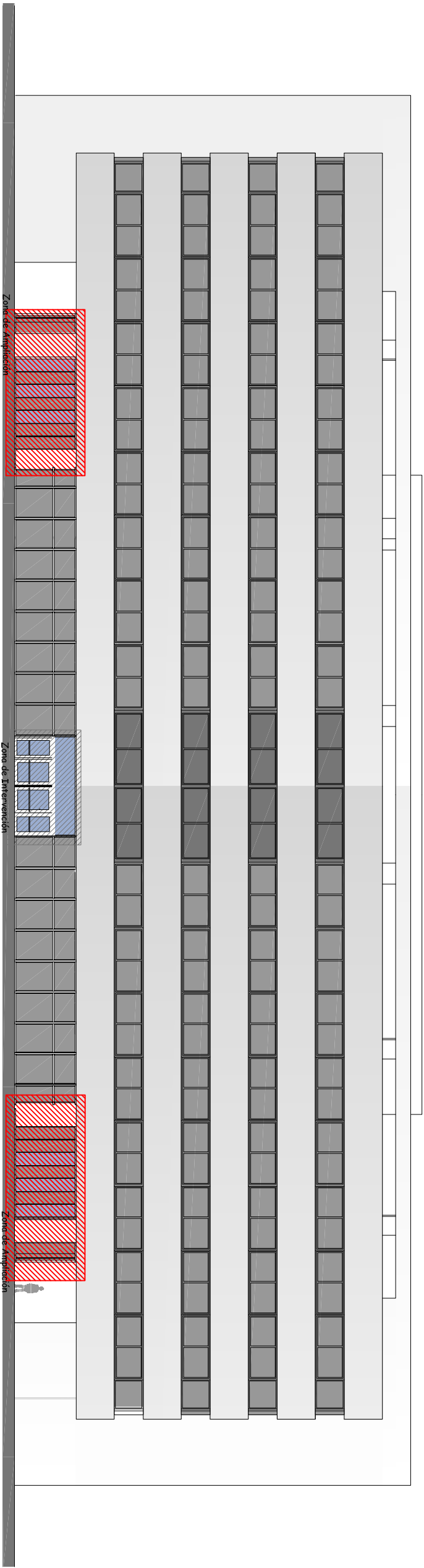
FACHADA ESTE -ZONA DE INTERVENCIÓN-